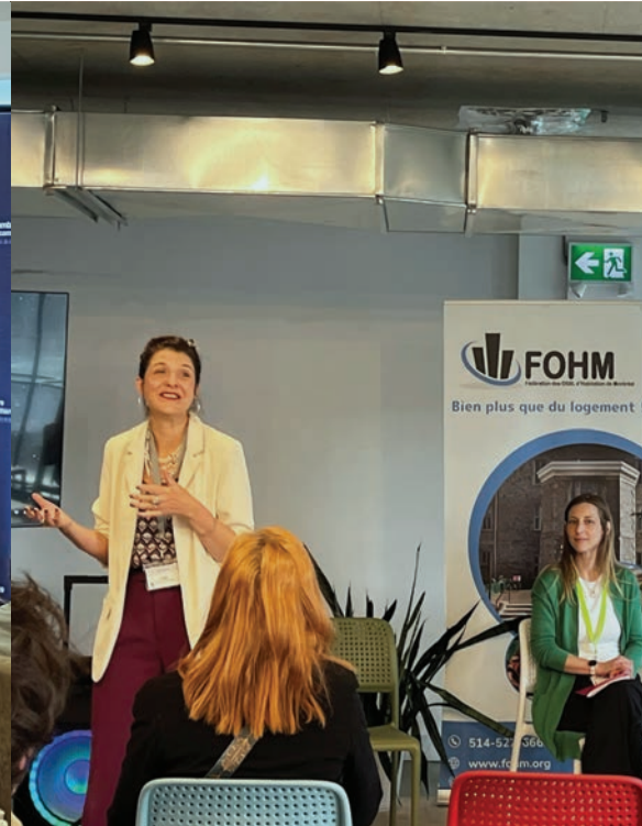
Débat préélectoral municipal de la FOHM