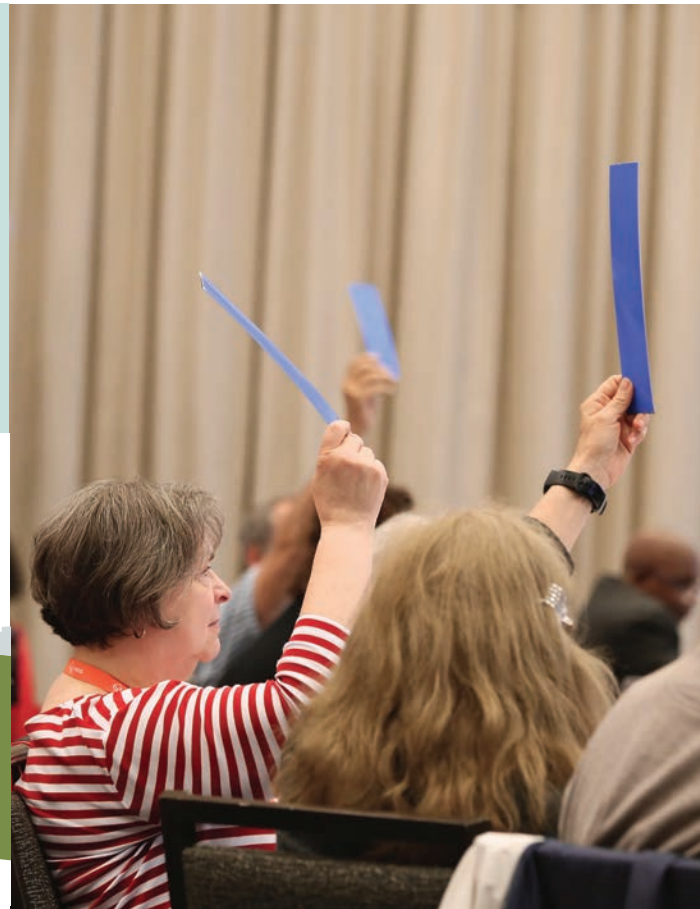
Période de vote à l'AGA 2025