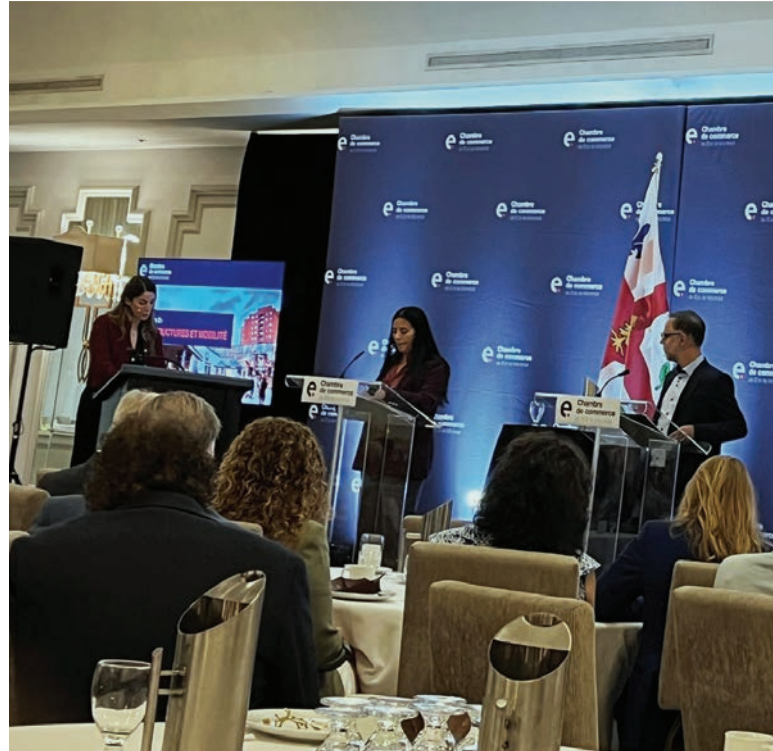
Débat à la Chambre de commerce de l'Est de Montréal