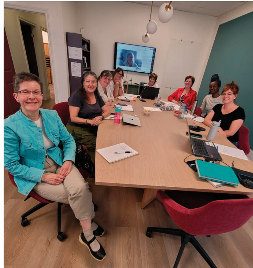
Groupe de travail de la TROCALL

La FHCQ est membre de la TROCALL (Table régionale des organismes communautaires autonomes en logement de Laval) qui regroupe aujourd'hui une quinzaine d'organismes représentant une variété de secteurs d'intervention et de clientèles, telles que les femmes, les personnes âgées, les personnes en situation de handicap, les personnes immigrantes, les jeunes, les personnes itinérantes, etc. Plusieurs rencontres ont eu lieu durant l'année en vue d'organiser une journée de réflexion collective sur le logement communautaire et social.