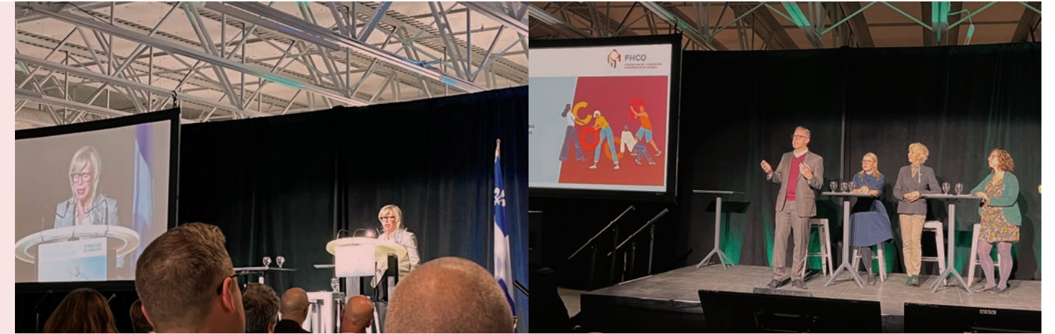
La ministre de l'Habitation, Caroline Proulx, lors du Rendez-vous de l'habitation de la SHQ

500 PERSONNES REPRÉSENTANT 161 COOPS ONT PARTICIPÉ