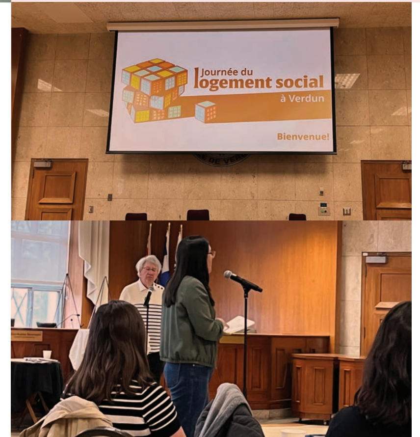
Journée du logement social - Verdun

La Fédération appuie également des initiatives à l'échelle locale. C'est ainsi qu'elle a assisté, le 20 mars, à l'assemblée publique sur le logement organisée par la Concertation Ville-Émard • Côte-St-Paul ainsi qu'au sommet sur l'habitation organisé par la Concertation sur le développement social de Verdun le 11 avril.