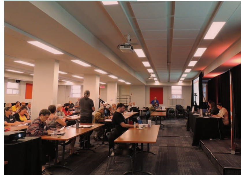
L'AGE du 27 septembre 2025

À l'ordre du jour : la modification du règlement n° 1 qui a été renommé « Règlement de régie interne ». Les membres ont répondu présents pour venir débattre de la mission de leur fédération, de son fonctionnement, de ses champs d'intervention et des moyens à sa disposition pour se déployer dans l'ensemble du Québec. La journée a donné lieu à de riches échanges permettant de faire valoir différents points de vue. Les membres ont été nombreux à répondre à l'appel.